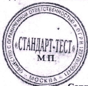
Схема сертификации: 1С. Ру № РЭН 2023/20253 от 18 мая 2023 г.